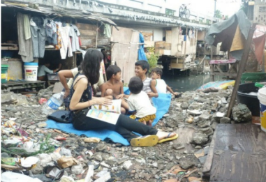
Ang Galing! historia de más de 100 familias que viven debajo del puente

Descargar Historia Taponi Ang Galing! en pdf