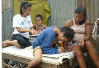
Padres y madres se implican en las actividades, ayudan con la creación de Ang Galing!